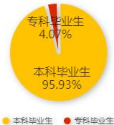
图 1-1 2023 届毕业生总体规模

学院 2023 届毕业生共 4643 人，其中本科毕业生 4454 人，占毕业生总人数的 95.93%；专科毕业生 189 人，占毕业生总人的 4.07%。